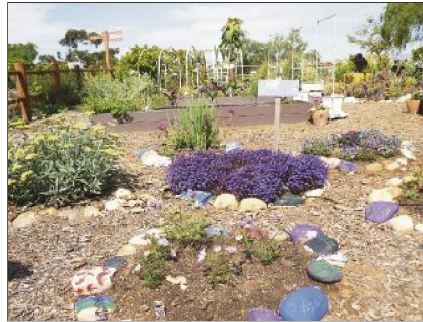
PROPUESTA. La interacción con la naturaleza incentiva el buen hábito alimenticio.

"Aquí los visitantes entran en contacto directo con la naturaleza. A los niños les incentiva escuchar el canto de los pájaros, ver las mariposas volando y apreciar a las mariposas. Es esencial que conozcan qué papel tienen cada uno de estos organismos en los cultivos", señala.